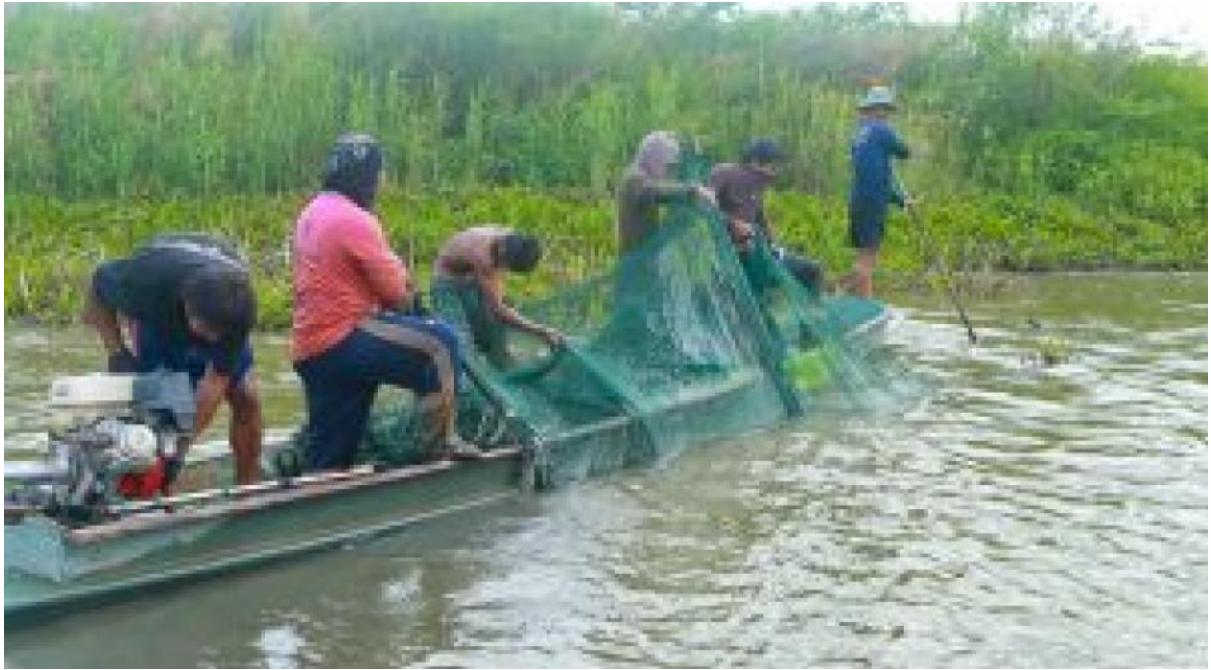
การทอเงเที้ยว พัก ชิม ซ้อป ในตำบลวังทอง