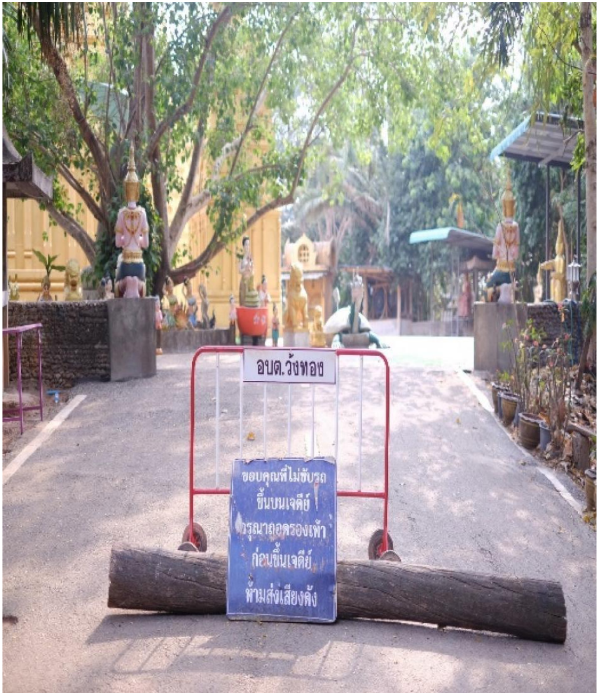
วัดป่าบ้านเหล่าหลวง หมู่ที่ 3 บ้านเหล่าหลวง ตำบลวังทอง