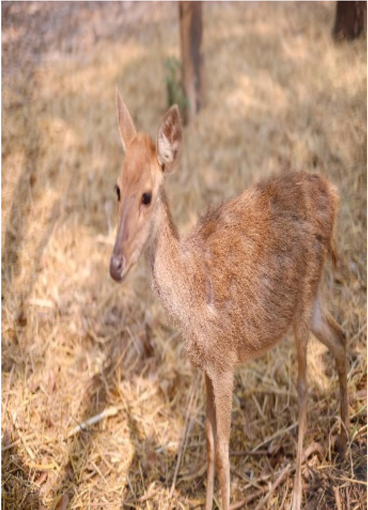
วัดป่าพุทธคยาดอนธาตุ หมู่ที่ 1 บ้านวังทอง ตำบลวังทอง